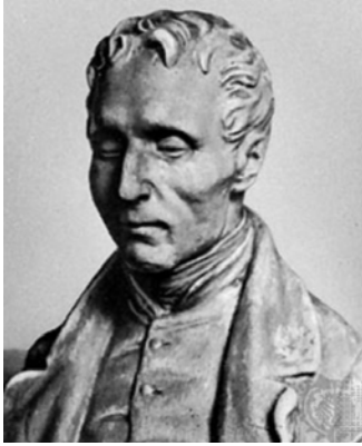
LOUIS BRAILLE, l'homme

Louis Braille naît le 4 janvier 1809 dans un petit village situé à l'est de Paris, petit dernier d'une famille de 4 enfants.